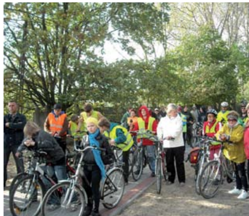
Ścieżka rowerowa Kietz-Kostrzyn nad Odrą – Barlinek

Wspólny Sekretariat Techniczny Programu Operacyjnego Współpracy Transgranicznej Polska (województwo lubuskie) – Brandenburgia 2007-2013 ul. Kościelna 2 65-064 Zielona Góra PL www.plbb.eu