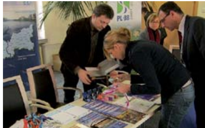
MG fot. archiwum Euroregionu

Euroregion Pro Europa Viadrina prezentował zakres swojego działania również na stoisku promocyjnym, które chętnie i licznie odwiedzali uczestnicy konferencji.