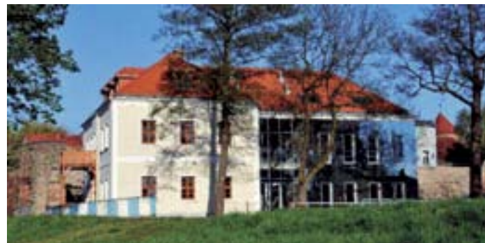
Dom Joannitów

Dzięki temu Dom Joannitów stał się miejscem, gdzie odbywają się najważniejsze polsko - niemieckie imprezy organizowane