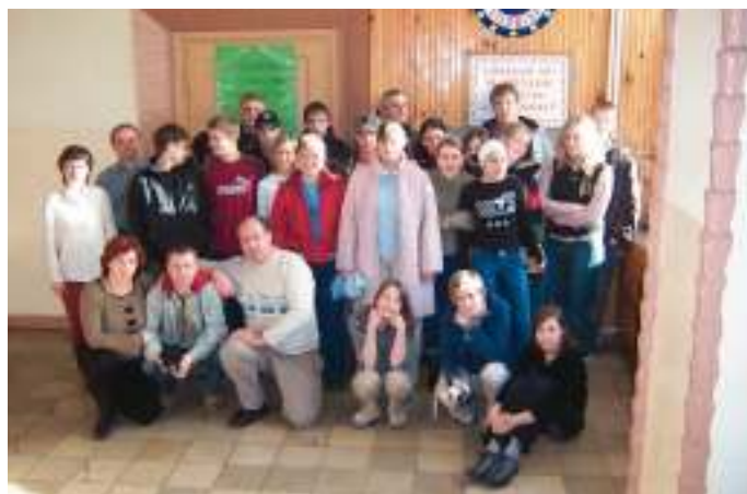
Grupa realizująca projekt „Zielnik Roślin Ujścia Warty”