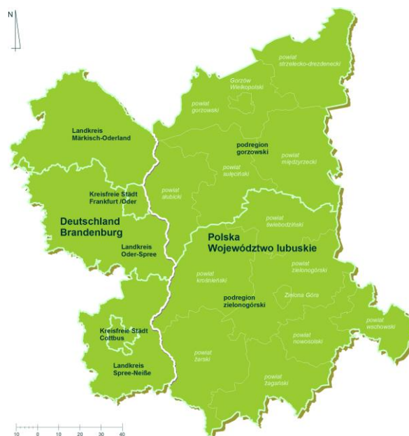
Abbildung 1: Übersichtskarte des Fördergebiets Rysunek 1: Mapa poglądowa obszaru wsparcia