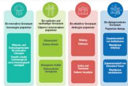
Prioritätsachsen und Förderschwerpunkte / Osie priorytetowe i priorytety wsparcia